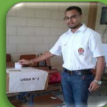
Estudiante Pedagogía Tocoa