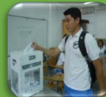
Estudiante de Enfermería

Se apoyó mediante orientación y acompañamiento a los estudiantes de Pedagogía del Centro Regional de Educación a Distancia CRAED-Tocoa y estudiantes de Enfermería de la Facultad de Ciencias Médicas en su proceso de conformación de asociaciones, las que se desarrollaron en un ambiente de respeto y honestidad, utilizando como forma participativa la elección por planilla mediante voto secreto escrutado en urnas, al finalizar los participantes quedaron satisfechos y mostraron una actitud de madurez cívica.